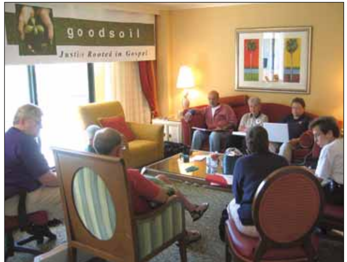
En la tranquilidad antes del comienzo de la IELA en Orlando, Buena Tierra se reúne en