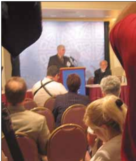
La prensa de los sectores nacionales, regionales, locales y religiosos asistieron a la asamblea de la IELA y a la conferencia de prensa del obispo presidente al comienzo...