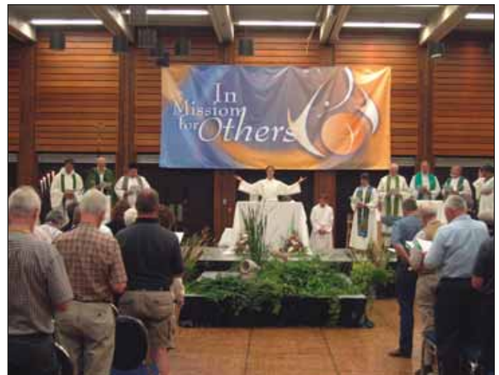
Al final en Canadá, alabamos juntos, como debemos, como luteranos...