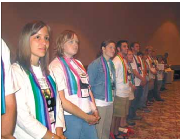
Buena Tierra creó un espacio de alabanza en un hotel cercano...