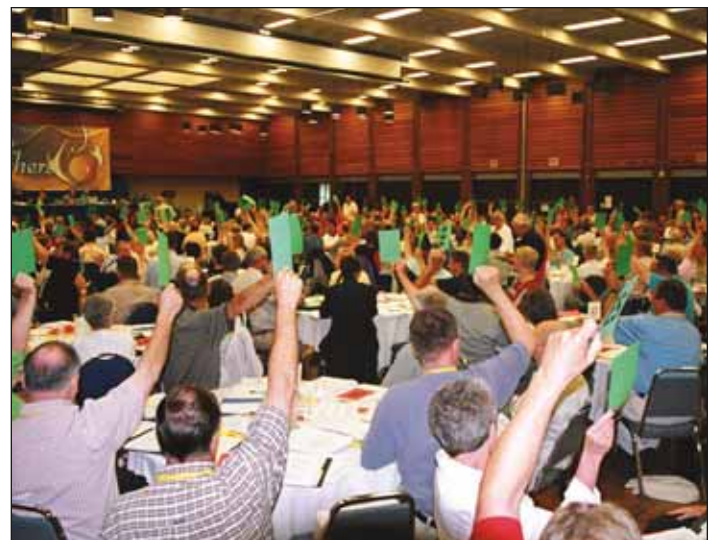
La Convención rebosadamente afirmó la bienvenida por la IELC de personas HBT dentro de la vida de la Iglesia, restableciendo la esperanza después de la derrota de bendecir relaciones del mismo género...