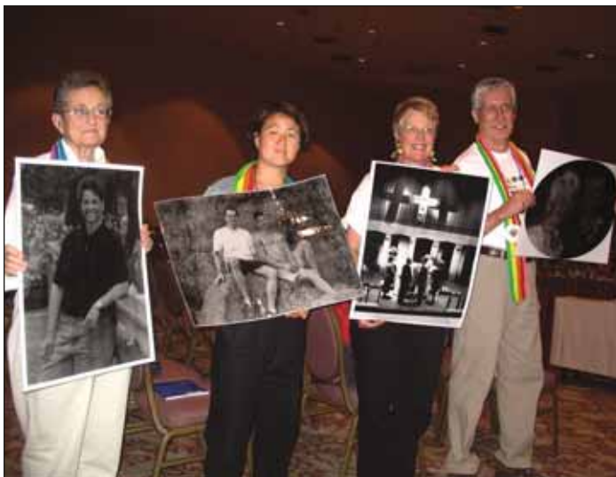
Buena Tierra estuvo de pie y presenció en la galería de visita y por los pasillos dirigiendo al salón de la asamblea votante todos los días...