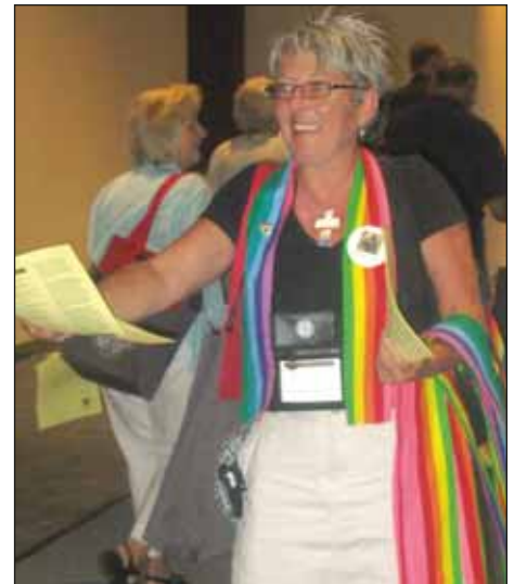
Buena Tierra dio a los miembros votantes mensajes diarios y estolas del arco iris si las querían...