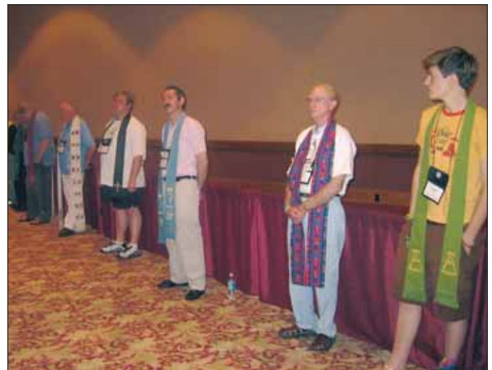
Buena Tierra estuvo de pie en vigilia silenciosa en la galería de visita, algunos (derecha) llevando las estolas del Proyecto de Estolas, recibido por o conmemorando a pastores que ya no pueden ser pastores cuando su orientación fue revelada o cuando fueron despedidos por ser HBT...