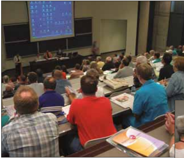
Nos reunimos en asamblea...