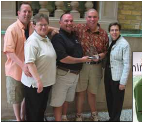
Dimos premios para servicio sobresaliente...