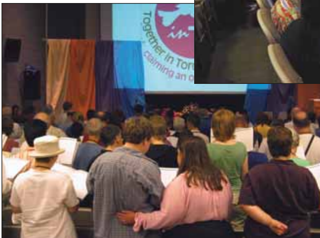
Y al final salimos hacia el mundo con un Espíritu Abierto nuevo y renovado.