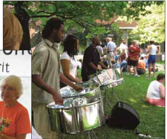
Almorzamos a los sonidos vibrantes de Melange...