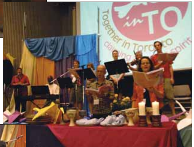
Alabamos con gusto...