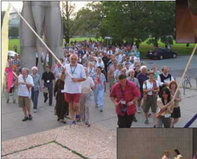
Fuimos llamados y dirigidos a alabar...