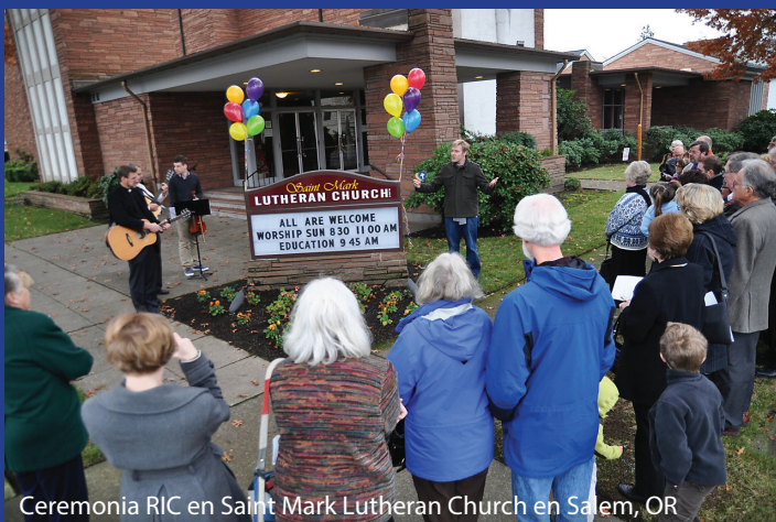
Ceremonia RIC en Saint Mark Lutheran Church en Salem, OR